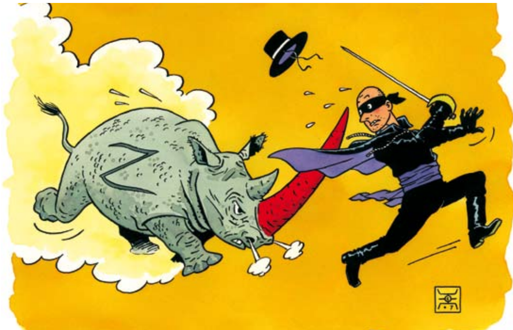
Exem, La corne de Rhino

De 2008 à 2010, la Maison de Quartier des Eaux-Vives ne suffisant plus à abriter une collection toujours plus grande, l'exposition-prêt annuelle se déroule dans le Foyer de la Comédie, ce qui permet en outre de faire connaître la Pinacothèque à un plus vaste public. En 2008, avec son déménagement à la rue de Montbrillant, la Pinacothèque des Eaux-Vives devient tout simplement la Pinacothèque, mais son ambition reste la même : mettre l'art à portée de tous.